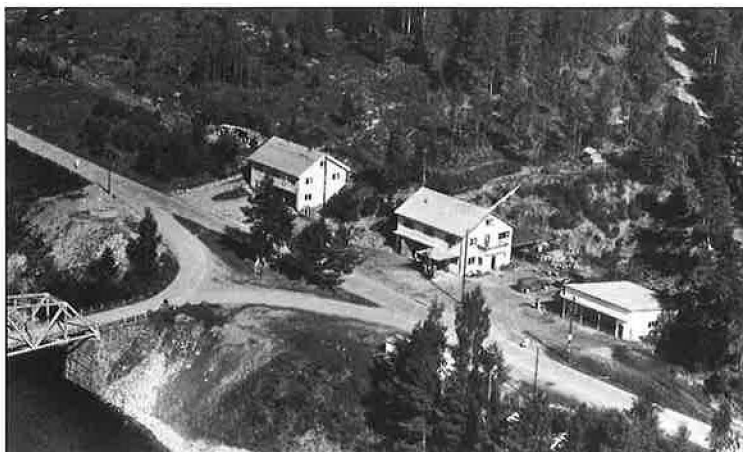
Den midtre bygningen er Brustad bensinstasjon.