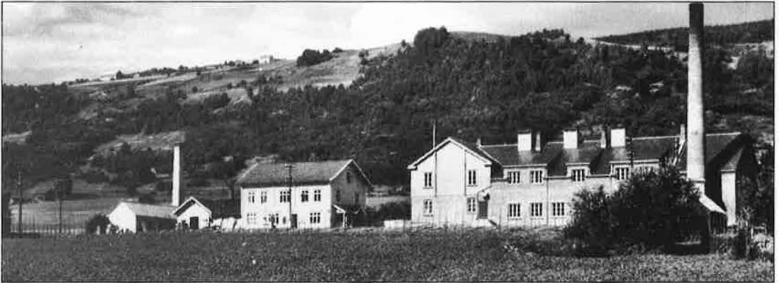
Øyer Handelslags første forretning fram til 1965. Huset er nå ombygd til bustadhus, Øyer ysteri som næraste nabo.