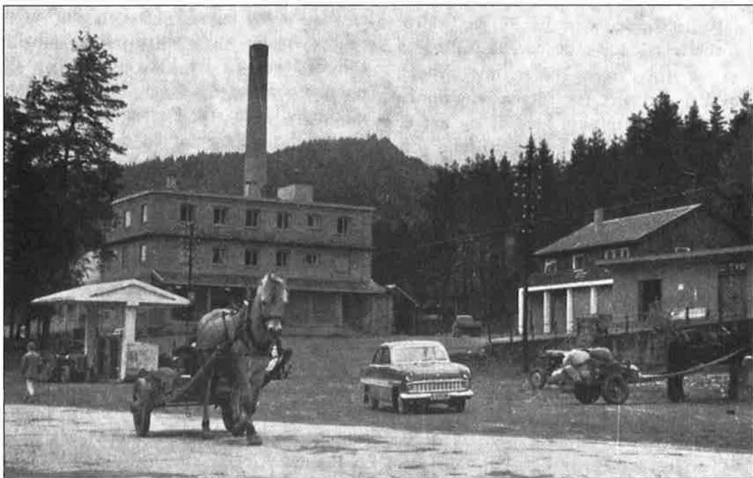
Tretten Ysteri med styrarbustad og bensinstasjon.

noko skadd, likevel ikkje verre enn at drifta kunne halde fram frå juli månad same året. På same tid vart 3. høgda påbygd.