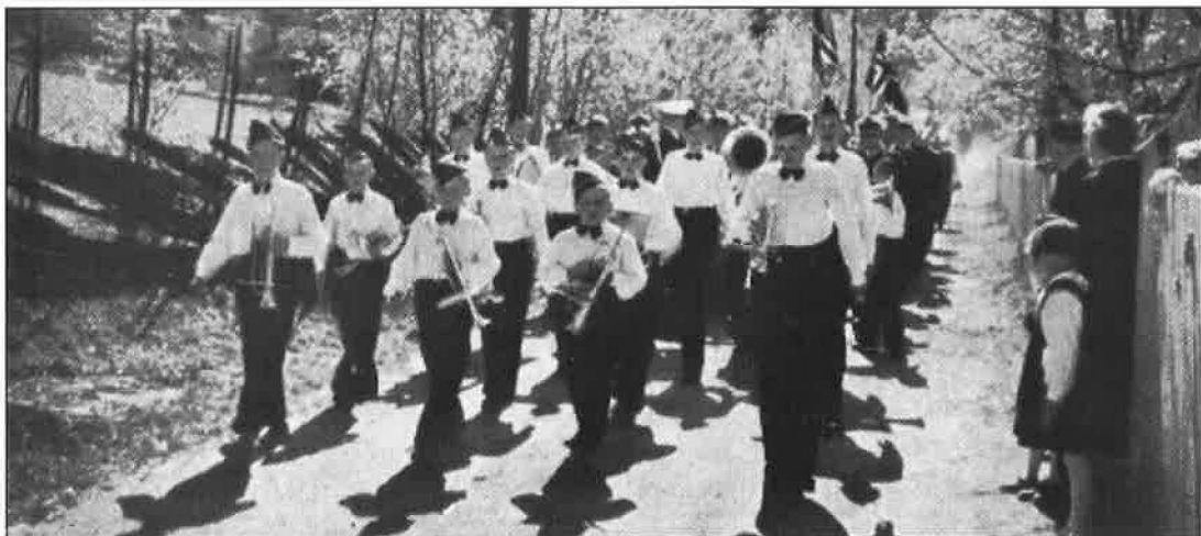
Tretten guttekorps klar for stemnet på Dombås i 1955

Utover på 60-talet var det dårlege tider for guttemusikken på Tretten, sjølv om dei i 1964 kunne skilte med tre "damer". Mannskapet frå musikkforeninga var "pytt og