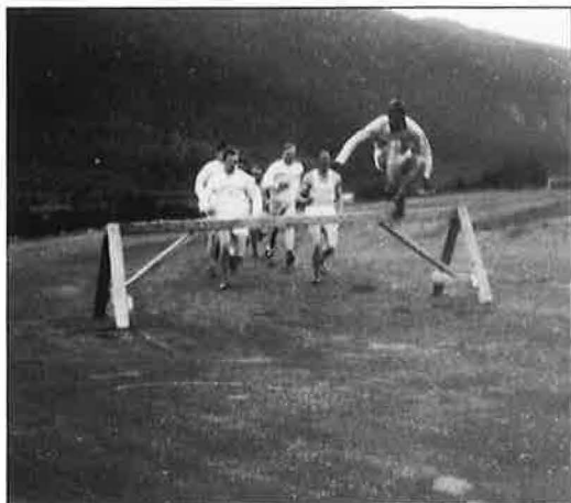
Hinderløp på Tretten idrettsplass i 1950 årene. På tross av at det var nedlagt en god del arbeide med anlegg av hinderløpsbane på plassen, ble denne lite benyttet, og ble forholdsvis fort nedlagt.

boka bevart. Her står dato for hver film som ble vist i Eriksrud disse årene, navn på filmen, antall tilskuere og billettinntekter. I 1947 var billettprisen for voksen kr. 1,75, barn kr. 0,75.