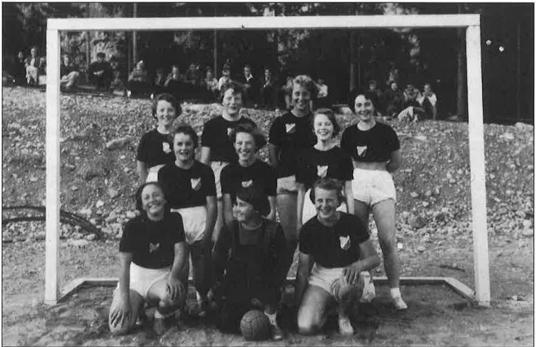
Tretten ILs jentelag, kretsmestere junior 1953: