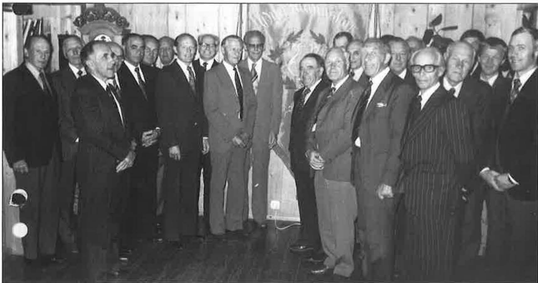
MIMRETREFF FOR MANNSKORET PÅ LUNKE I 1976