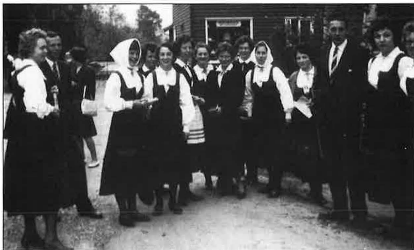
Medlemmar frå Trettten ungdomslag på tur til stemnet i GU på Otta i 1963