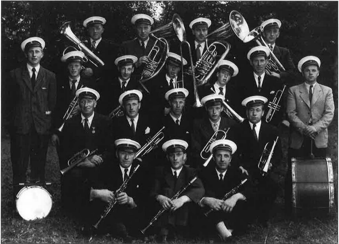
ØYER MUSIKKFORENING ca. første del av 50-talet

Det kan sjå ut som det snur litt for øyvæ- ringane dei første åra på 50-talet. Eit opp-