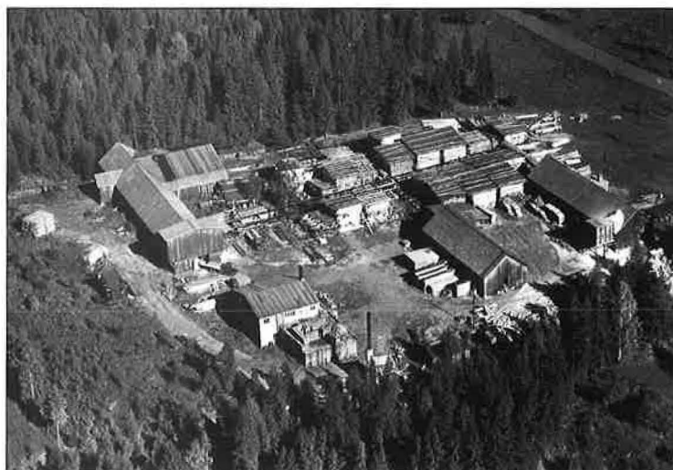
Gamle Bruvoll Sag.

I vinterhalvåret var 8-10 mann sysselsette. Utanom sesongen hadde 4-5 mann arbeid. Sagbruket vart nedlagt omkring 1970.