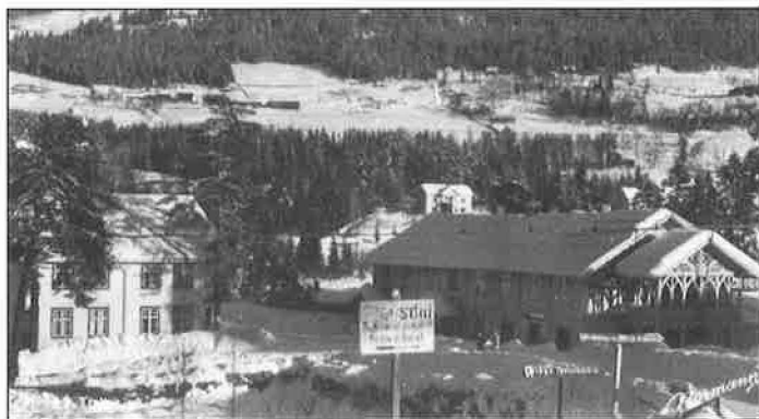
Tretten vestside Parti frå "stasjon". Solheim til høggre, Wasrudbutikken til venstre.