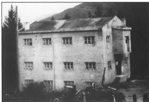
Gamle Nermo Mølle.

Dei fyrste åra etter krigen var mølla i drift frå haust til vår, men frå fyrst på 50-talet var det heilårsdrift. To menn hadde arbeid i mølla.