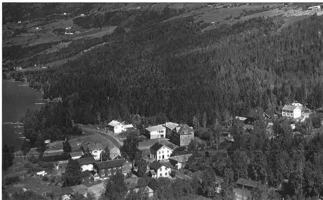
Tingbergplassen i 1959. Midt i bildet er Solheimsbygningen.

Utsalet låg i Ysteribygingen der Øyer Landbruksverksted nå held til. Der vart det seld mjølk og fløyte, rumme, smør og ost av ulike slag, alt saman i laust mål og laus vekt. Øyer Ysteri vart nedlagt frå 1. januar 1956 da det vart samanslege med Tretten