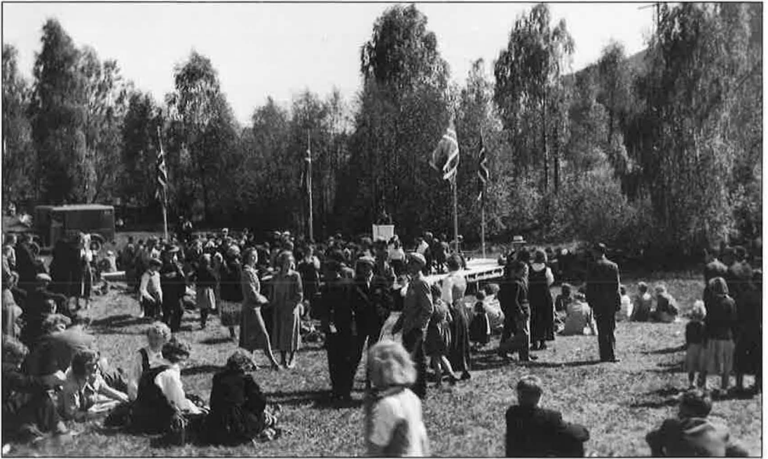
Frå stemneplassen på Moshus-sletta – nå Enga.