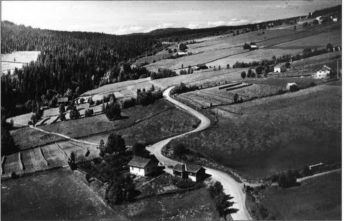
Parti frå Musdal 1952. Dulven nedst.

på nytt landhandel der. I 1957 selde han verksemda til Solstad som heldt på til 1960. Men da vart det ikkje meir handelsverksemd der.